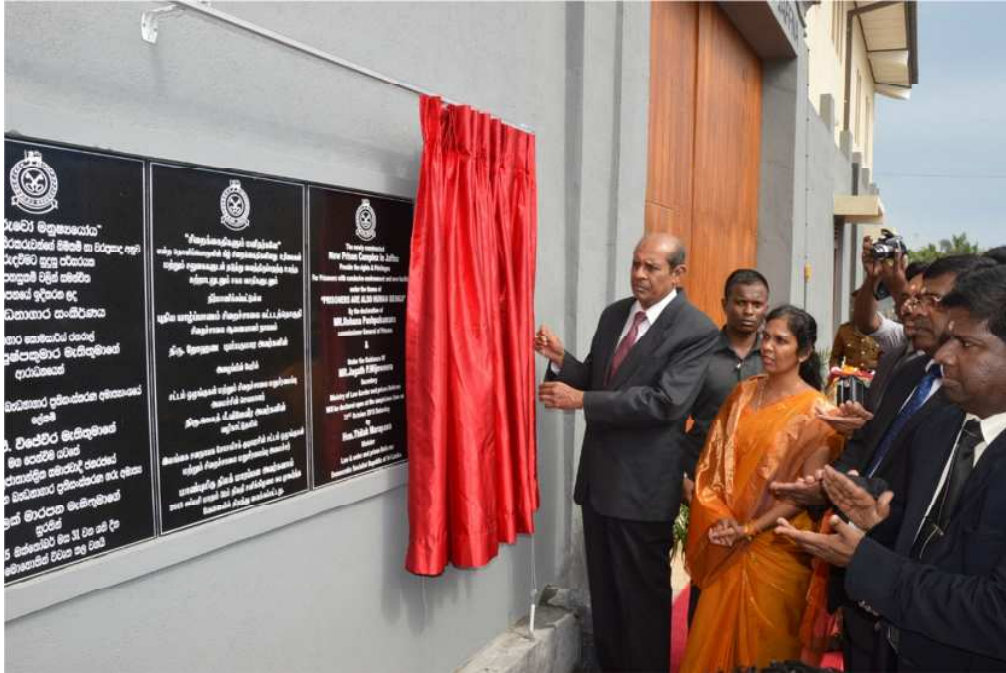
නව බන්ධනාගාර කොමසාරිස් ජනරාල් එච්.එම්.එන්.සී.ධනසිංහ මහතා වැඩ භාර ගැනීම